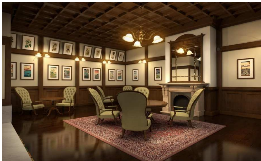
ゲストサロン (イメージ)

日本美術、日本古来の技法によるアートなど、数々の作品でお客様をお迎えします。伊藤若冲「伏見人形図」や浮世絵など、北海道ではなかなか出会う事のない美術品を、ロビー、客室、ゲストサロンなど、館内随所でお楽しみいただけます。