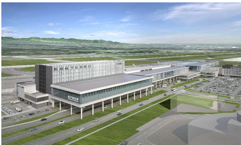
新千歳空港国際線ターミナルとホテル外観

「旅に出逢いと彩りを」をコンセプトに、出逢いを大切にすることをお約束し、心あたたまるパーソナルサービス・洗練された寛ぎをご提供致します。新千歳空港国際線ターミナル直結という北海道の玄関口で、全室が43㎡以上の広い客室と、館内各所にちりばめた日本美術の作品と共にお客様をお迎え致します。私たちは北海道コンシェルジュの役割を担い、道内各地、さらには日本の美しさ、文化をお伝えして参ります。