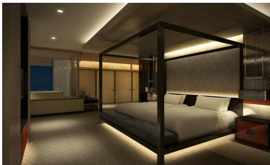
琳派スイート (イメージ)