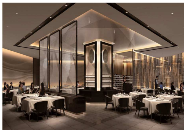
TATERU YOSHINO 店内イメージ